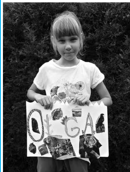
Zamek Cieszyn zaprasza całe rodziny na zabawę z literami i czcionkami.

Tegoroczny Dzień Dziecka w Zamku Cieszyn będzie inspirowany krojami pism, czcionkami, literami. Najmłodszych zaprosimy na warsztaty typograficzne pod tytułem: „Alfabet wyobraźni”. Ich uczestnicy zaprojektują m.in. własne kroje pism, a także będą rozmawiać o tym, jak „kształt” i kolor liter pomaga w komunikacji. Warsztaty odbędą się 2 czerwca , początek o godz. 15.00. Zapraszamy całe rodziny!