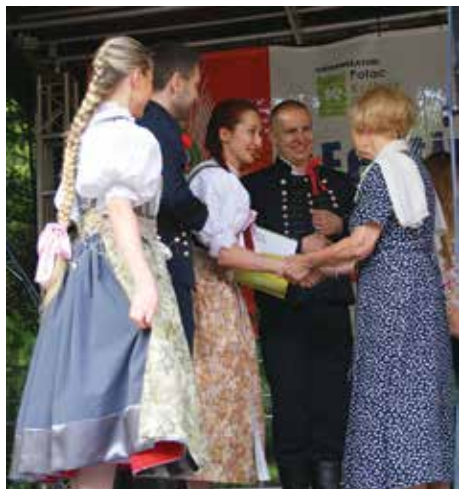
Dwie grupy ZPiTzC zdobyły I miejsce w kat. zespołów tanecznych na Festiwalu Folklorystycznym.

17 i 18 maja, dwie grupy Zespołu Pieśni i Tańca Ziemi Cieszyńskiej im. J. Marcinkowej uczestniczyły w konkursie V Międzykulturowy Festiwal Folklorystyczny „Zagłębie i sąsiedzi” odbywającym się w Dąbrowie Górniczej.