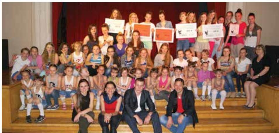
Uczestnicy Konkursu Tańca DANCE CIESZYN 2013.