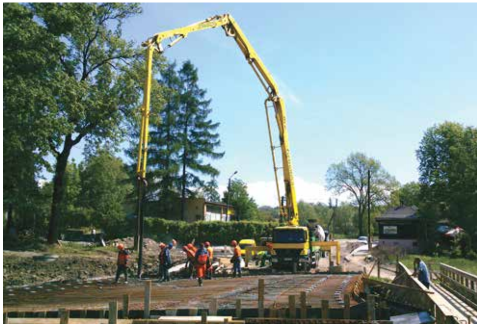
Prace przy budowie mostu na A. Łyska postępują, jednak prawdopodobnie ostateczny termin zakończenia robót przesunie się na czerwiec.