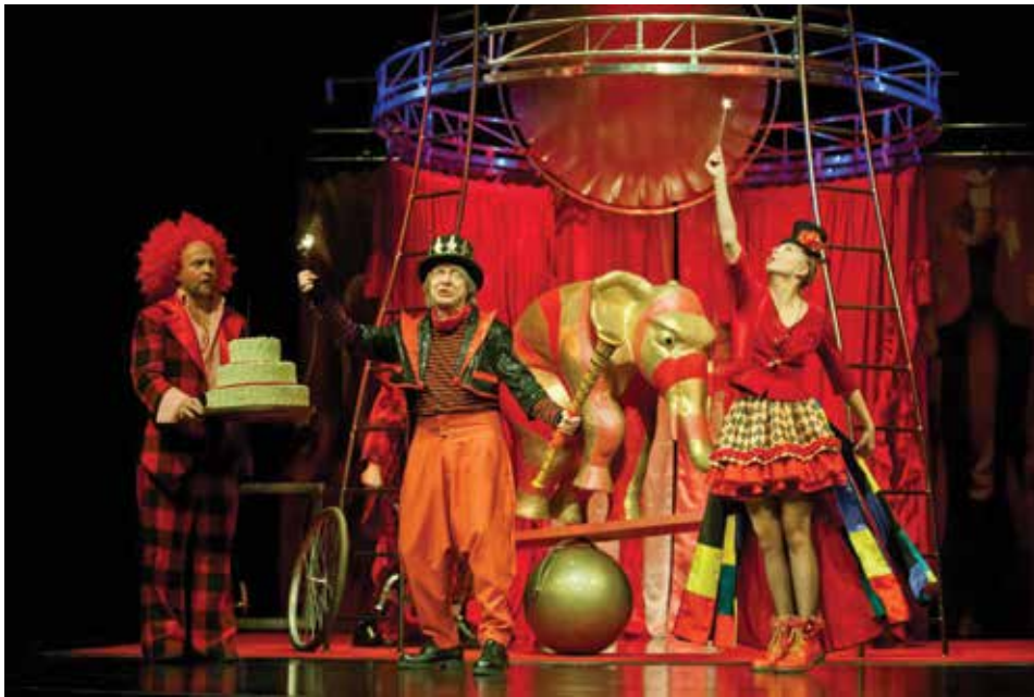
„Bal u Króla Lula” - to przedstawienie zobaczą dzieci podczas inauguracji Festiwalu.