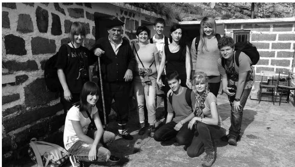
Uczniowie z Gimnazjum nr 3 w ramach Programu Comenius współpracują ze szkołami z Portugalii, Francji, Włoch i Hiszpanii (z Kraju Basków).