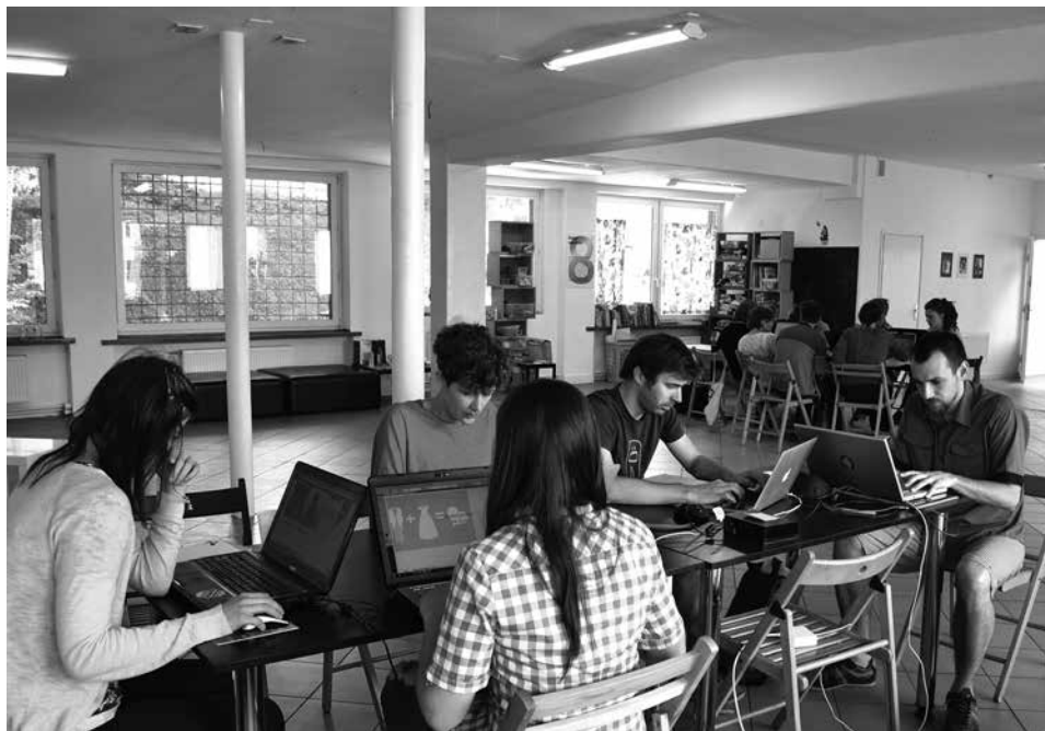
Młodzi projektanci pracowali nad projektami materiałów informacyjnych itp. dla Muzeum Protestantyzmu oraz Hospicjum im. Łukasza Ewangelisty.

Grupa młodych projektantów z Polski, Słowacji, Węgier i Finlandii odwiedziła cieszyńskie Hospicjum im. Łukasza Ewangelisty oraz Muzeum Protestantyzmu, by wspólnie stworzyć dla nich nowe lub odświeżyć już istniejące projekty graficzne.