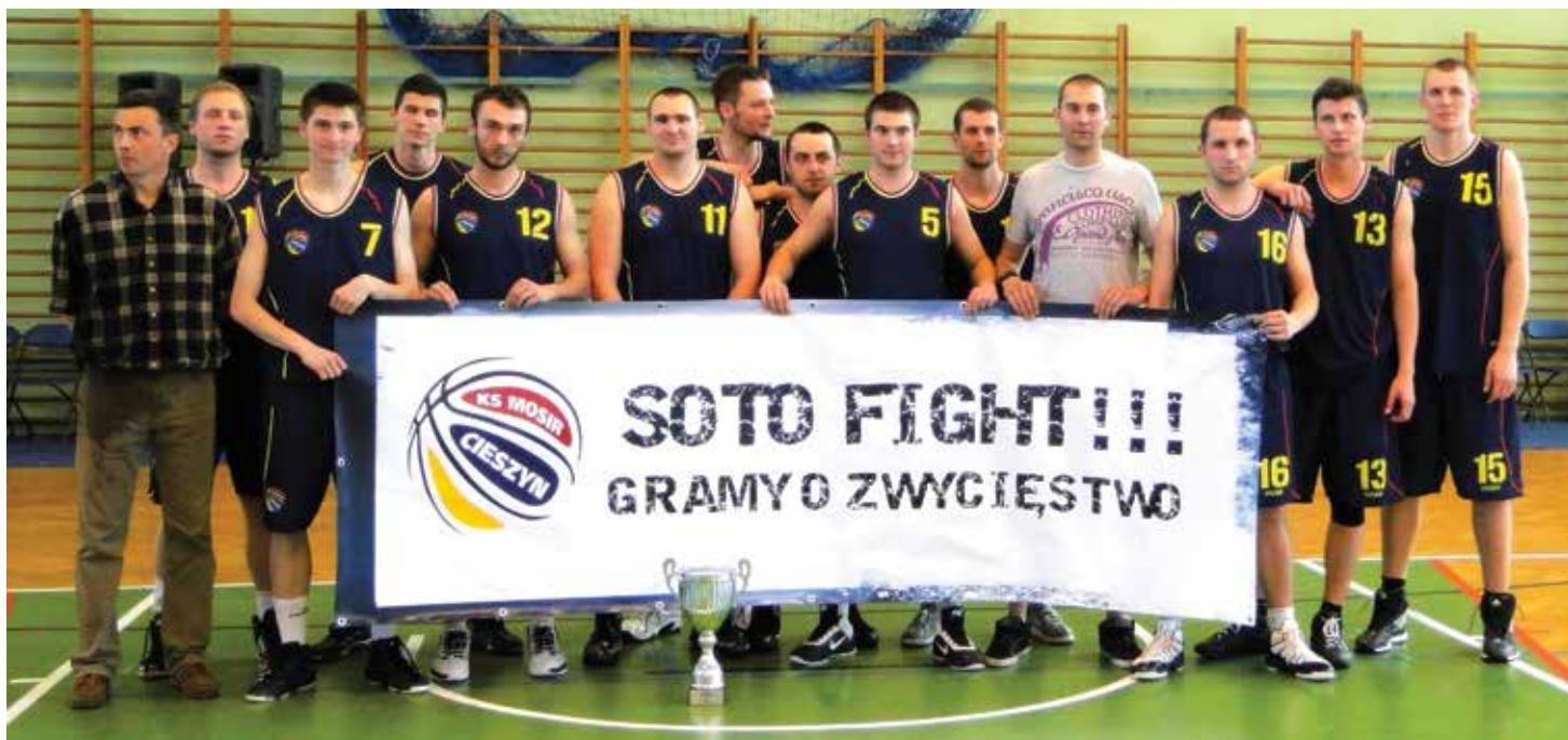
Koszykarze KS MOSiR Cieszyn przypieczętowali swój awans do drugiej ligi dzięki bardzo dobrym wynikom w tym sezonie.