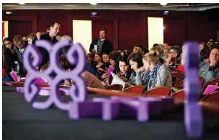
Widzowie tłumnie odwiedzali sale kinowe.