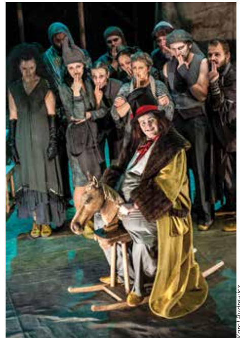
„Komedia obozowa” - na deskach Teatru w Cieszynie 6 czerwca.