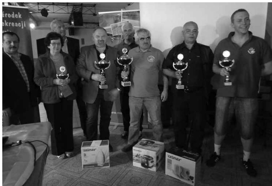
Selekcja Skata KS MOSiR Cieszyn