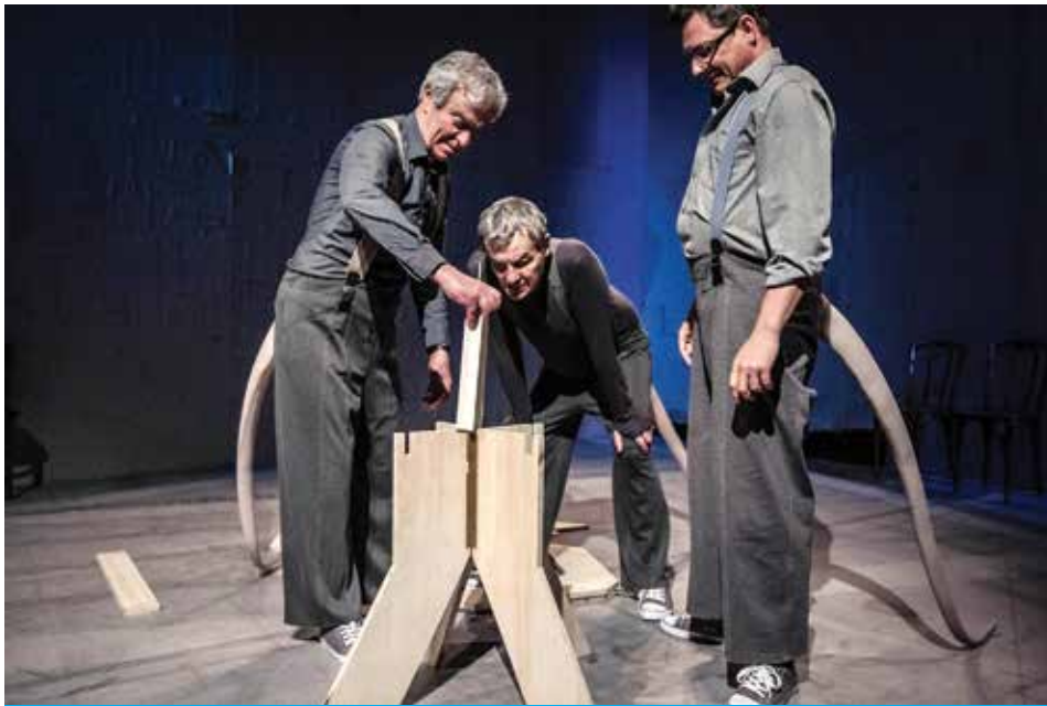
Gracze z cyklu Jeżyce Story - zapraszamy do cieszyńskiego Teatru 8 czerwca.