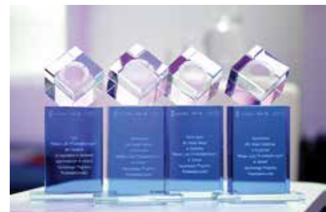
Cieszyn zdobył tytuł Miasta ludzi przedsiębiorczych.

„Jestem bardzo wzruszony. Cieszyn jest miastem przyjaznym dla przedsiębiorców. Zarówno rada miejska, jak i władza wykonawcza robimy wszystko, żeby klimat dla przedsiębiorców do prowadzenia własnej działalności gospodarczej był jak najlepszy. Rozmawiamy z przedsiębiorcami i staramy się rozwiązywać ich problemy.” – mówi Bo-